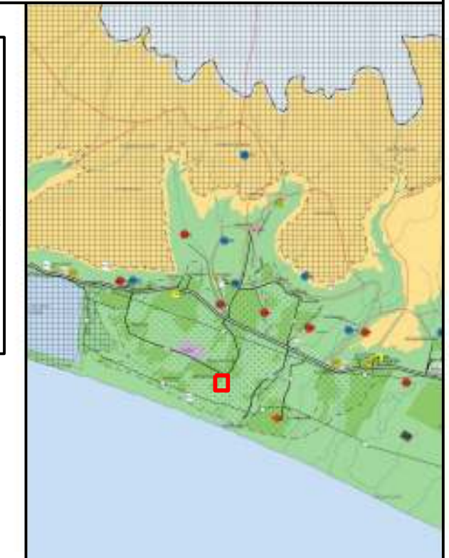
ÚR AÐALSKIPULAGI RANGÁRÞINGIS EYSTRA 2012 - 2024